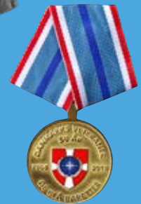
DV 50-års Mindemedalje