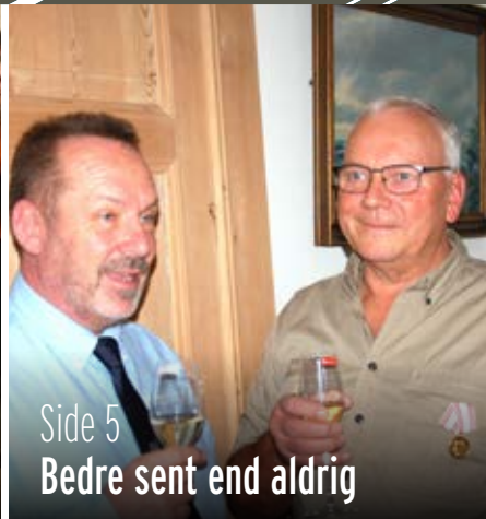
Side 5 Bedre sent end aldrig