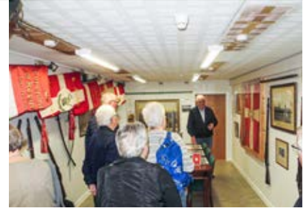
Besøg i Prinsens Livregiments Mindelokaler. Viborg & Omegn.