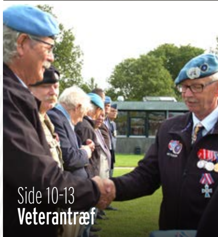
Side 10-13 Veterantræf