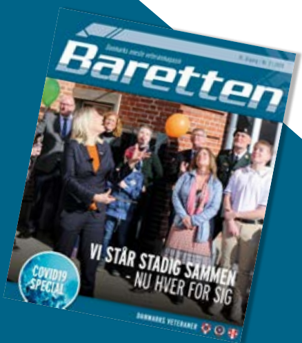
Forsvarsministeren åbner Familieenheden.

Vi har som veteraner prøvet at være inde-spærret før i op til halve og hele år, uden ret meget kontakt til vores nærmeste, så vi ved, hvad det betyder med nedlukningen af samfundet, som det er sket nu.