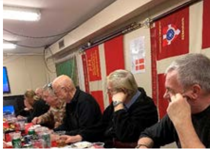
Fra generalforsamlingen. København.

Nu sidder vi her midt i en coronatid og tænker tilbage på tiden siden generalforsamlingen, som var en med det mindste antal deltagere i mange år, med det resultat at det ikke var muligt at få en fuldtallig bestyrelse. Efterfølgende kunne vi ikke konstituere os, idet vi mangler 2 bestyrelsesmedlemmer, 1 suppleant, fanebærer til NATO-fanen og fanevagter til alle 3 faner. Formanden havde ønsket at