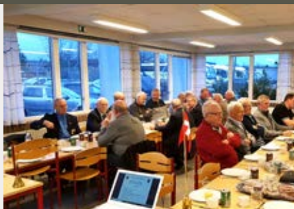
Fra generalforsamlingen. Midtjylland.