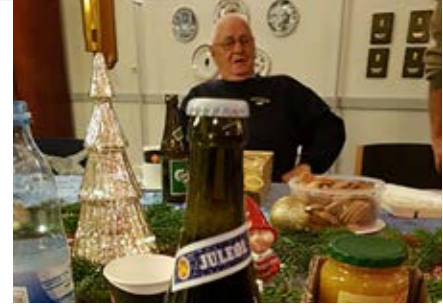
Fra generalforsamlingen. Limfjorden.

Alle aktiviteter starter kl. 19.00 og husk tilmelding 4 hverdage før til formanden.