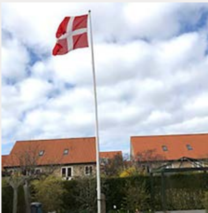
Dannebrog kom til tops på H.K.H. Dronning Margrethes fødselsdag. Bornholm.

Som bekendt er øens store events, såsom Folkemødet, Etape Bornholm og lignede aflyst. Så det bliver heller ikke her, vi kan mødes.