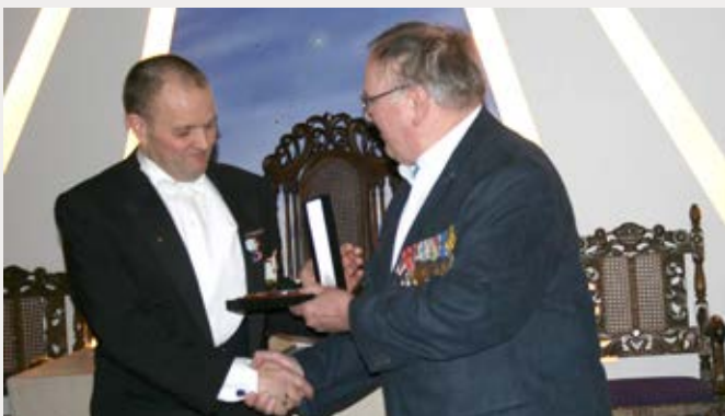
Overrækkelse af caféens skjold.