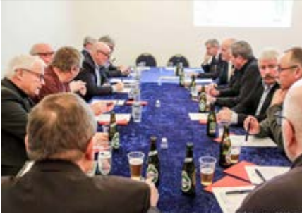
Generalforsamling 2020. Foto: Christian. Næstved & Omegn.