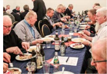
Gule ærter ved generalforsamlingen 2020.