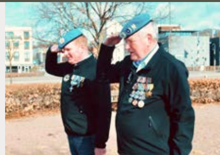
Ved Mindestenen den 4. april. Kronjylland.