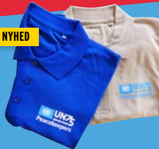
Polo shirt m/FN 75-års logo på