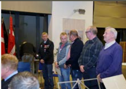
Modtagere af årstegn. Kronjylland.