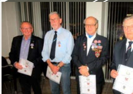
Modtagere af årstegnene. Sønderjylland.