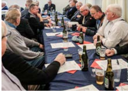
Generalforsamling 2020. Foto: Christian. Næstved & Omegn.