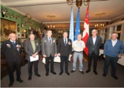
Rindsholm Kro. Viborg & Omegn.