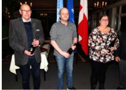
Fra generalforsamlingen. Viborg & Omegn.