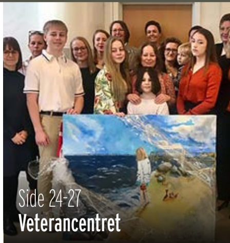
Side 24-27 Veterancentret