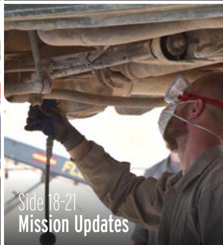
Side 18-21 Mission Updates