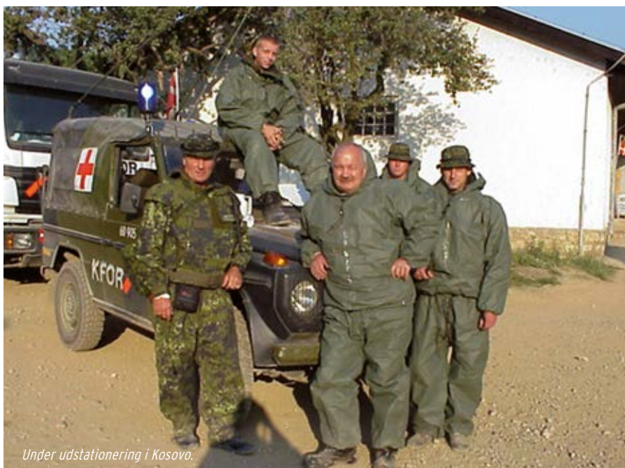
Under udstationering i Kosovo.

Der kan i øvrigt henvises til artiklen om Finn Warburg i Baretten 1/2011, side 10 - 11. Du kan finde bladet på Danmarks Veteraners hjemmeside under tidligere udgaver af Baretten.