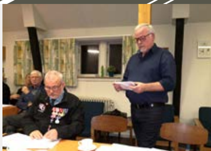
Fra generalforsamlingen. Nordvestsjælland.