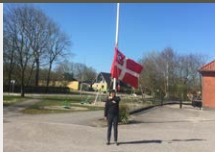
Fejring af Dronningen sammen, men hver for sig. Thy, Mors & Salling.

Ved generalforsamlingen kunne vi uddele års-tegn til: